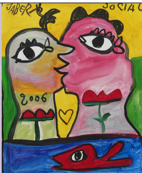
Le baiser, 2006 Jaber al Mahjoub (artiste d'Art brut)

Exprimer la séduction avec les arts du visuel. Voici un exemple :