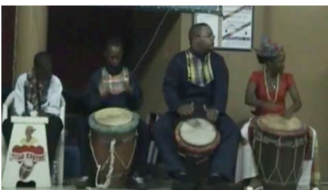
Le groupe Tchô Kontré